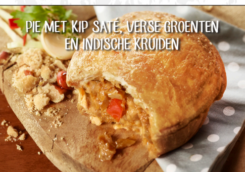
PIE MET KIP SATÉ, VERSE GROENTEN EN INDISCHE KRUIDEN