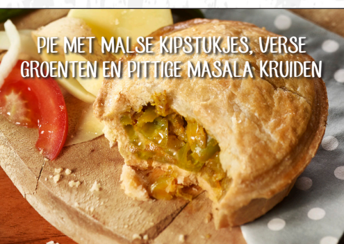
PIE MET MALSE KIPSTUKJES, VERSE GROENTEN EN PITTIGE MASALA KRUIDEN