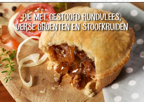
PIE MET GESTOOFD RUNDVLEES, VERSE GROENTEN EN STOOFKRUIDEN