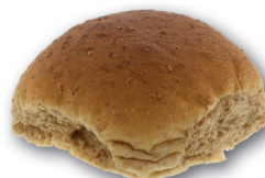
Zachte tarwe bol