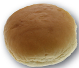
Mini witte bol