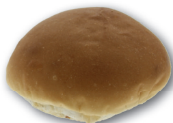
Vezelrijk witte bol