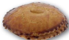
RB gevulde koek